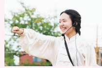
氣功・太極拳・推拿(すいな) 中国全体の体験