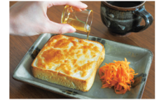
コーヒー・自家製ドリンク・軽食の販売