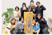
『教えて！足立区のおすすめスポット』マップ作り