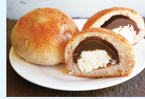
パン・焼き菓子の販売