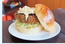
「24の日」バーガー・ステッカー・豚汁の販売