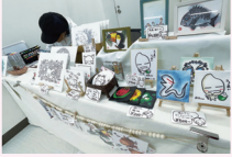
ぬりえワークショップ