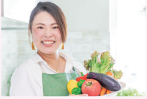
野菜の切れ端を使ったスタンプ作り