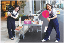
温かいこたつで竹の塚について語り合う架空のスナック