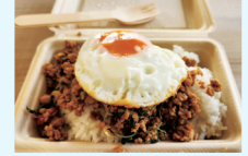
タイ人シェフが作る本格タイ料理のお弁当販売