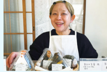
玄米・酸酵弁当の販売