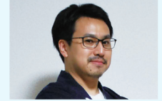
創業100年を超える老舗人形店の蔵出し市