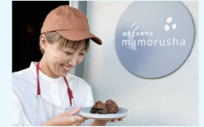
酵素玄米を使ったおにぎりの販売