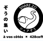
ドリップバッグやフランス菓子の販売