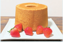
米粉シフォン・へちまスポンジ等の販売