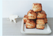
かりかりスコーンの販売