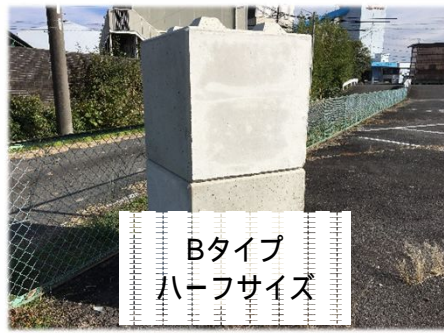
Bタイプ ハーフサイズ

レミブロックは、廃棄されてしまう 戻りコンや、残コン由来の材料を使用 するので、 資源を無駄にしません！