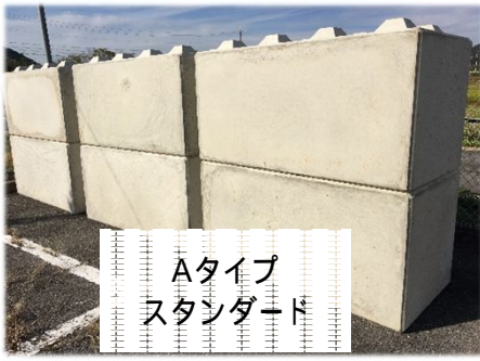
Aタイプ スタンダード