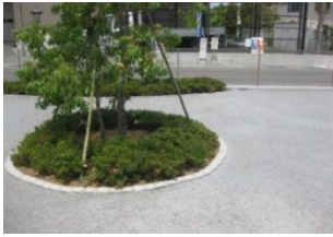
コミュニティエリア