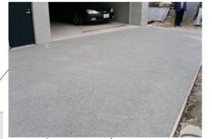
パーキングスペース