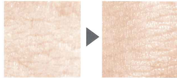
使用前 ハリがなく、キメが粗い 使用後 ハリがあり、キメ細かい肌に

※使用後の写真にに関しては、ジームスシャワーを10分間浴びた後の拡大写真になります。石鹸・シャンプー・コンディショナーなどは一切使用していません。