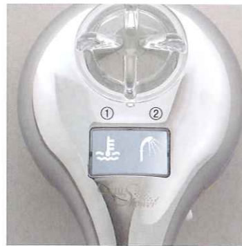
①温度確認ランプ ②流量確認ランプ

水素を効率的に発生させるのに最適な水温・水量を表示する機能を搭載。外部電源を使用しない水流発電です。3色の光が鮮やかに状態を表示します。