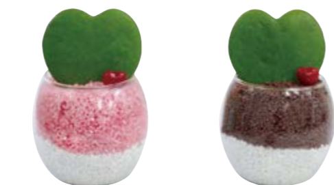
00057 ピンク 00058 ブラウン

LOT: 4ヶ 発送LOT: 24ヶ 鉢サイズ: W105×D90×H55mm 鉢素材: 陶器 植物: ホヤカラーサンド植え