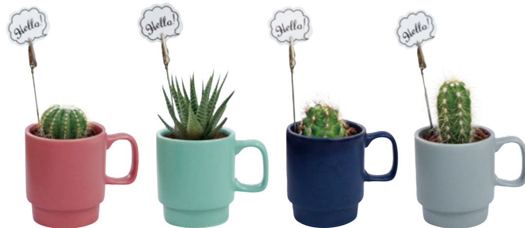
00160 ピンク 00161 ライトグリーン 00162 ネイビー 00163 グレー

Cactus スタッキングマグカクタス ¥1,400+税 00160 ピンク 4573356 651609 00161 ライトグリーン 4573356 651616 00162 ネイビー 4573356 651623 00163 グレー 4573356 651630