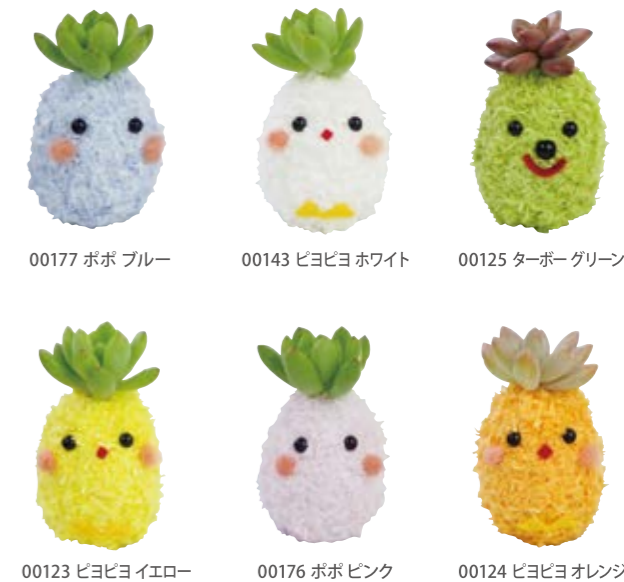
00177 ポポ ブルー 00143 ビヨビヨ ホワイト 00125 ターボーグリーン