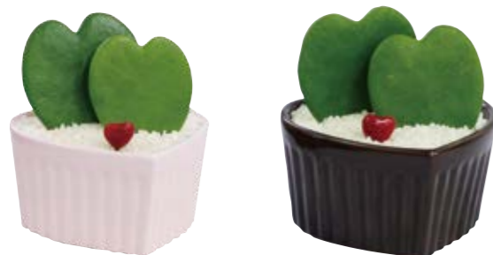
00138 ピンク 00139 ブラウン

LOT: 4ヶ 発送LOT: 24ヶ 鉢サイズ: W105×D75×H85mm 鉢素材: 陶器 植物: サボテン植え込み