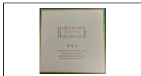
②生キャラメル ミルク