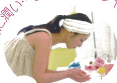
炭酸美容 & 洗顔