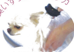
大切なペットのデイリーケアに