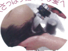
重炭酸・頭皮クレンジング