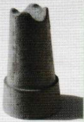
Aタイプサイズ・入数表