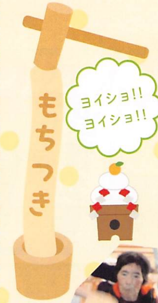
ヨイショ!! ヨイショ!!