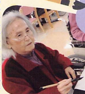
みんなで 書き初め