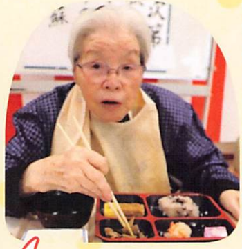
とてもおいしいです♪