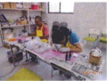
レジンを使った活動をしています

授産活動ではこれまでで作った商品(レジンを使った雑貨、万華鏡、アクセサリー、草木染めのストールなど)を展示させて頂き、希望者の方には販売もさせて頂きました。ご購入頂いた皆様、どうもありがとうございます。