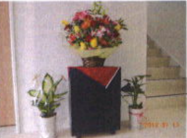
きれいなお花と観葉植物を頂きました

作業以外の活動、体育活動やおでかけやクリスマス会などのレクリエーションの様子を模造紙で写真の展示を行い、説明させて頂きました。 地域の方々、利用者の保護者の方々、関係機関の方々、内覧会中はたくさんの方々にお越し頂きました。利用者の方々は見学の方々に少し緊張しつつも声をかけて頂いたり、知っている方に来て頂くことと喜んでいたり、普段と違った雰囲気それぞれ楽しんでいただけた様子でした。