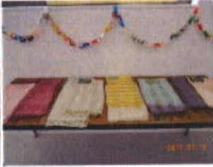
草木染めのストール