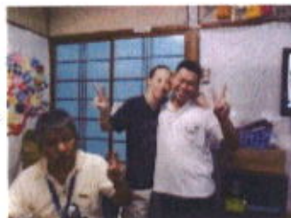
クッキング&食べることはみんな大好きです！

八月十七日土曜日、一日事業所を開け、お昼にお好み焼き、おやつにどら焼きと白玉団子をみんなで作りました！ カメラを向けるとみんな楽しそうな表情でピース！ 楽しかったねとみんなニコニコで帰宅されました。