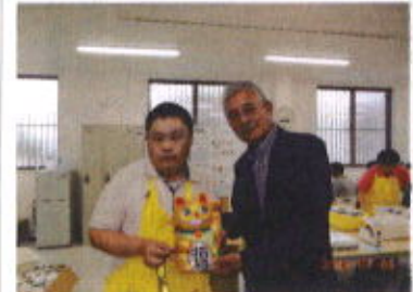
ようきすなお会様から張り子を頂きました