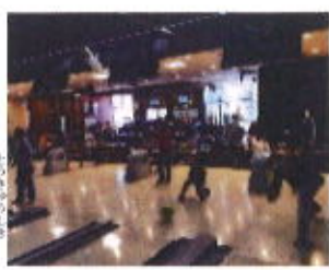
熱い闘いが行われています！

ボウリングのチーム分けは事前に決めていたのでまずはボール運び、重さを確かめたり少しその場で振ってみたりと自分にあったボールを真剣に選んでおられました。