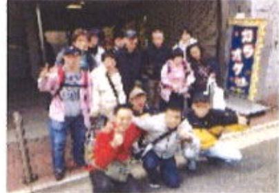
楽しい時間をみんなで過ごせました

おまちなかねのボウリングの結果発表です！「1位！〇〇(職員)さん」と言った瞬間メンバーさんからブーイング(笑)。皆さん自分が一番と思っていただけにガッカリですよね。最後は店の前で記念写真を撮り、楽しい