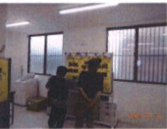
熱心に見てくださっています

授産活動ではこれまでで作った商品(レジンを使った雑貨、万華鏡、アクセサリー、草木染めのストールなど)を展示させて頂き、希望者の方には販売もさせて頂きました。ご購入頂いた皆様、どうもありがとうございます。