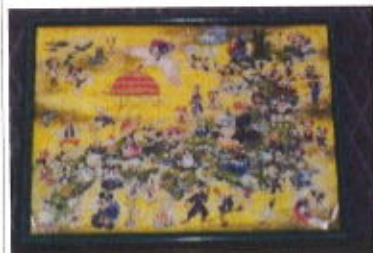
1 2時間で完成しました!

昨年末のイベントではありますが、第十九号の新聞では掲載しきれなかった間に合わせたため、月日は経ってしまいましたが、こんなイベントも行いました。二〇一八年十二月十四日、希望する利用者と共に、イオンモール四條畷へおでかけを行いました。各グループに分かれ、フアッシュンショップ・グルメショップ・アミューズメントショップへ行ったりしました。お使いを頼まれていた方もいれば、家族に買っていった方もい