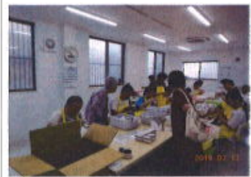
組み立て作業を行っています

事業所の内容や取り組みなどを地域の方々に知って頂くため、七月十二日金曜日、十三日土曜日に「内覧会」を開催しました。