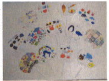
かわいいイラストが描かれたうちわ

作業以外の活動、体育活動やおでかけやクリスマス会などのレクリエーションの様子を模造紙で写真の展示を行い、説明させて頂きました。 地域の方々、利用者の保護者の方々、関係機関の方々、内覧会中はたくさんの方々にお越し頂きました。利用者の方々は見学の方々に少し緊張しつつも声をかけて頂いたり、知っている方に来て頂くことと喜んでいたり、普段と違った雰囲気それぞれ楽しんでいただけた様子でした。