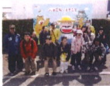
みんな興味津々な様子で見学していました

三月二十日水曜日、高槻市にある明治製菓の工場「明治なるほどファクトリー」へ、車2台でメンバー十名・職員三名で行って来ました！明治製菓の歴史などみんなと学んだり、お菓子が作られている様子を見学したりして、2時間くらい滞在しました。その後、大日まで戻りイオンで昼食やショッピングを楽しみました！