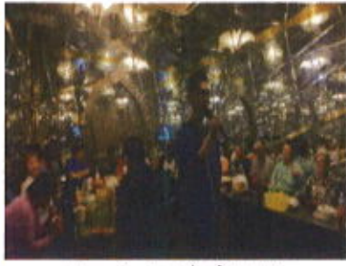
みんなでのカラオケは盛り上がりです！

しかしここで失敗したのがカラオケにはフリードリンクがついていたのですが皆さんセットを購入されたためドリンク付き一杯分損した気分でした。 カラオケも盛り上がり部屋の温度もマックスに！しかしエアコンの調子が悪くなかなか涼しくならないので部屋を変更してもらいました！快適な部屋に移動して再スタート！カラオケ時間も少しとなってきたためボウリングの結果発表をする事に！1位！3位がなんと世話人さんでした。今回すごく調子が良