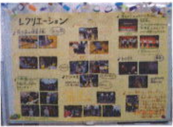
レクリエーションの様子を紹介しました