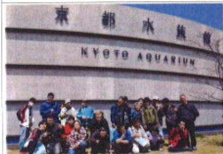
天気もよい一日でした！

四月十二日金曜日、京都水族館へ行きました。 いつもおでかけは電車で行くのですが今回は車で移動で、約2時間で水族館へ到着しました。 水族館に入るとまずは天然記念物のオオサンショウウオがお出迎え！さらに、アザラシ、ペンギンなど、たくさん海の生き物がいました。メインはイルカのショーです！始まる前からパントマイムの人が会場を盛り上げてくれ、本番もイルカのダイナミックな泳ぎやジャンプにみんな拍手！とても見応えのあるショーでした。 昼食は予約していた和食レストランで頂き、帰路につきました。