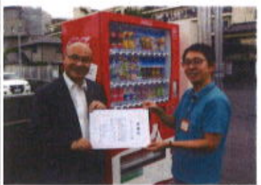
感謝状を頂きました

来所記念として、来て頂いた皆様、利用者さんの描いたイラストが入ったうちわと、縫製せずにのりで貼って作ったポケッ トティッシュケースをお渡しさせて頂きました。 自販機設置 開所に伴い、八月八日、大阪府共同募金会の共同募金協力型の自動販売機が設置されました。八月二十二日に共同募金会の林田常務理事が訪問され、感謝状を頂きました。 今回設置された自販機の売上の一部は、大阪府共同募金会に寄付され、守口市の社会福祉のために使われます。また、この自販機は現金以外に一部の電子マネーも利用できます。(文責：森)