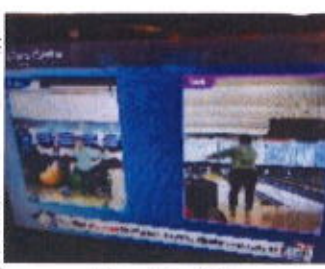
さたなかさんの美しい投球フォーム

チームは事前に決めていたのでボール運び！なぜか一番重たいボールを選びたがる一人のメンバーさん！理由を聞くと「いっぱい倒れるから」(笑)と！腕が痛くなるからと説得し本人さんにあるボールを選んでもらいました。