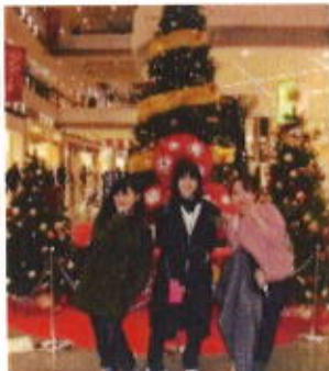
イオンへおでかけ