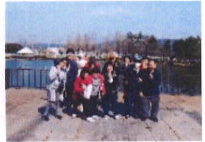
天気にも恵まれました！

さあ今年も来ました！弁天池での花見！ 今年も：やっぱり！四葉のクローバー探し。見つかるかな？見つかるかな？と皆探しているメンバーさんいれば、ベンチをベッド代わりにして昼寝！これも花見らしくて良いね！ さてさて：今年の四葉のクローバーは？もちろんたくさん見つかりました！ 早速、事業所へ持ち帰り押し花にしているメンバーさんおられました！