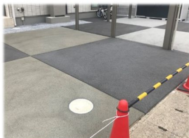
岐阜市 グレー＆ブレン