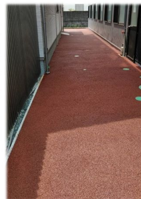
山県市の工場 レンガ 建物の間の通路を側溝と 水勾配無しで施工