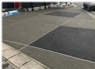
愛知県江南市 グレー＆ブレン

施工は簡単ですが、色ムラが起りにやすい性質があります。初めての方には、施工方法や目地の入れ方などのアドバイスをいたしますので、お気軽にお問い合わせください。