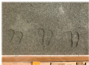
新築記念に、お子さんの靴跡を立体的に残しました。