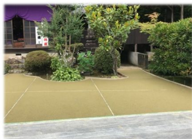
岐阜市 お寺の境内にイエロー