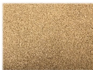
自転車置き場までのスロープをベージュで施工。 冬場にスリップしにくいのでポーラスアイを採用。 1㎡をDIYしました。