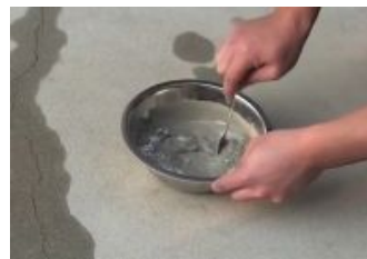
クラックメンテを水で溶きます。