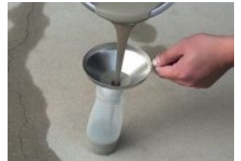
注入容器に入れます。