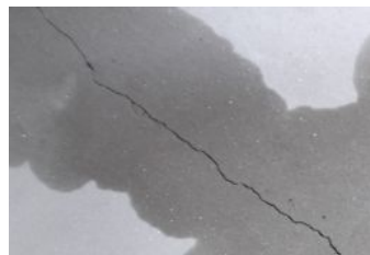
ひび割れに水を浸透させます。