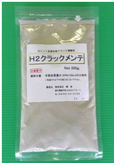
ひび割れ補修材 H2クラックメンテ

これくらいのひび割れ、ありますよね。犬走りとか駐車場とか... 「H2クラックメンテ」を使えば、手軽にひび割れ補修ができます。 とにかく簡単！特殊な道具はいりません。(100円均一で揃います) 0.5mm～3mm幅の微細なひび割れに充填ができます。 水で濡れていても補修できます。 ひび割れ内部に浸透して補強します。 セメント系のため、コンクリートとの相性もよく、補修跡が目立ちにくくなります。