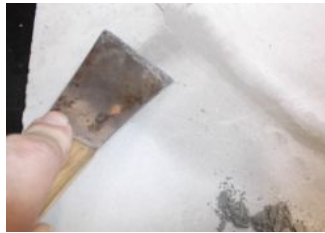
少し固まったら、余分な部分を削り取ります。